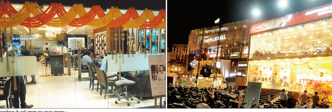
धनतेरस के पूर्व संस्था पर सजा बाजार।