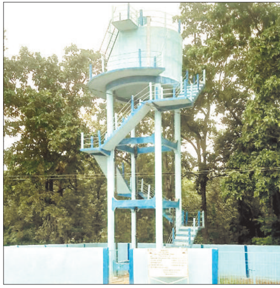
अब दोनों योजनाओं को एक ही प्रोजेक्ट से संचालित करने का निर्णय लिया गया है। मल्टी विलेज योजना जल जीवन मिशन योजना के बाद आयी इस योजना अंतर्गत ग्राम एतमानगर के नाम से नया प्रोजेक्ट लागू किया गया था। इसके तहत बांगो

ग्रामीण अंचलों में बांगो बांध से लगभग सौ गांव को तक पानी पहुंचाने के लिए लागू की गई। मल्टी विलेज योजना भी अब जल जीवन मिशन अंतर्गत संचालित होगी। अब तक पीएचई विभाग की जल जीवन मिशन और मल्टी विलेज योजना अलग अलग थी। दोनों योजना के लिए विभाग को अलग अलग मद से वित्तीय राशि जारी होती थी। घर घर तक पानी पहुंचाने वाली जल जीवन मिशन और मल्टी विलेज की एतमानगर प्रोजेक्ट दोनों अलग अलग मद से संचालित हो रहे थे। जबकि दोनों का काम घर घर तक पानी पहुंचाने का ही था। दोनों योजना के लिए अलग अलग प्रस्ताव और डीपीआर तैयार हो रहे थे।